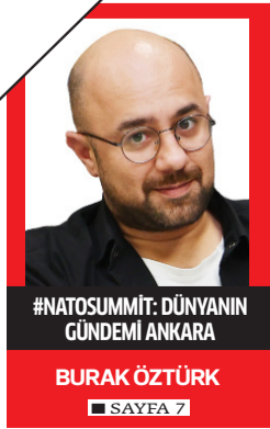
#NATOSUMMIT: DÜNYANIN GÜNDEMİ ANKARA BURAK ÖZTÜRK SAYFA 7

■ Türkiye'nin kültür ve sanat alanındaki en kapsamlı ödül programlarından biri olan "2. İGA ART Sanat Projeleri Yarışması"nın kazananı, sanatçı Hayri Karay'ın İGA İstanbul Havalimanı için tasarladığı dev ölçekli kinetik heykeli üretim sürecini konu alan fotoğraf sergisi, dış hatlarda yer alan İGA ART Galerisi'nde sanatseverlere kapılarını açtı. İGA İstanbul Havalimanı'nın simge eserlerinden biri haline gelen 37,7 metre yüksekliğindeki heykeli geçtiği aşamaları belgeleyen sergide fotoğraflar, teknik çizimler ve görsel dokümanlar yer alıyor. Hareketli iki parçadan oluşan eser, çelik ve ışık arasındaki ilişkiyi özgün bir yorumla ele alıyor ve izleyicisinin bakış açısına göre anlamlar üretiyor. ■ 7'DE