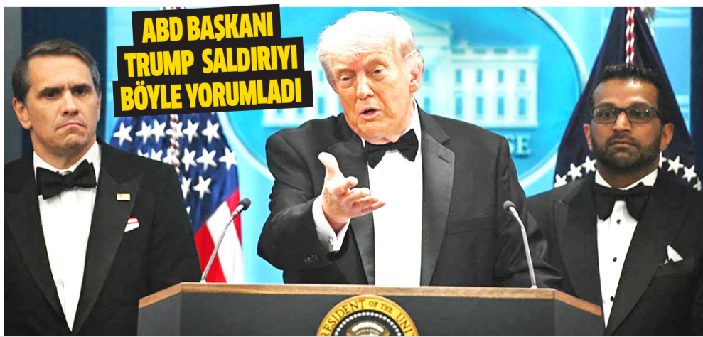
ABD BAŞKANI TRUMP SALDIRIYI BÖYLE YORUMLADI

GAZZE'DE CAN KAYBI 72 BİN 587'YE YÜKSELDİ 6