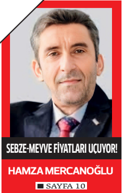
SEBZE-MEYVE FİYATLARI UCUYOR! HAMZA MERCANOĞLU SAYFA 10

İsrail güçlerinin, Lübnan'ın güneyinde düzenlediği saldırılarında en az 7 sivil hayatını kaybetti. Lübnan Sağlık Bakanlığı ise saldırılarda 24 kişinin yaralandığını, yaralıların arasında üç çocuğun da bulunduğunu açıkladı. ■ 6'DA