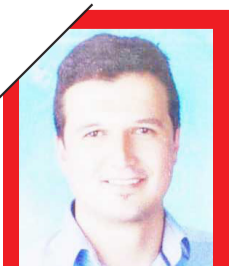
VALİ GÖLGESİNDE ADALET SINAVI SÜLEYMAN EFE ■ SAYFA 10

Telefon yasağı, sıkı arama uygulamaları ve öğle arası çıkışların kaldırılmasıyla okulda disiplin ve kontrol üst seviyeye çıkarıldı. ■ 7'DE